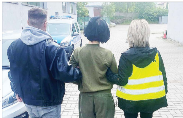
Zatrzymana przez policję w maju 2025 roku