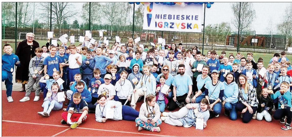
Uczniowie i nauczyciele podczas Niebieskich Igrzysk zorganizowanych w Szkole Podstawowej nr 1 im. Marszałka Józefa Piłsudskiego w Ciechocinku