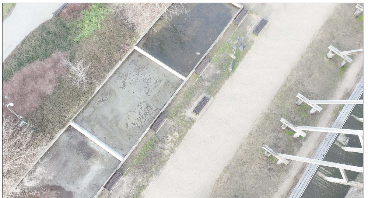
Inne ujęcie z drona betonowych „koryt” przy tężni nr 1