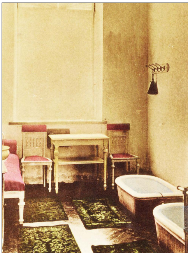
Gabinet z wannami kąpielowymi w łaźniach nr I - 1908 r.

Wybuch Powstania Listopadowego zapoczątkował okres całkowitej stagnacji i marazmu we wszystkich dziedzinach życia społeczno-gospodarczego na terenie Ciechocinka. Dopiero jesienią 1833 roku wykonano fundamenty pod budowę przyszłej austerii z łaźniakami. Ostatecznie budowę austerii z łaźniakami ukończono pod koniec sierpnia 1834 roku. Głównym materiałem budulcowym au-