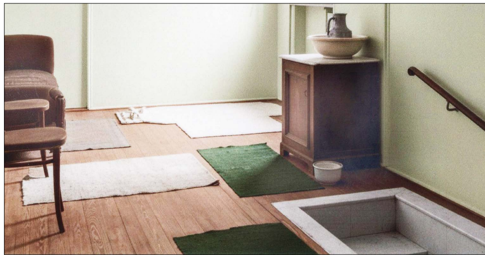
Gabinet z wannami kafelkowymi w łaźniakach nr I