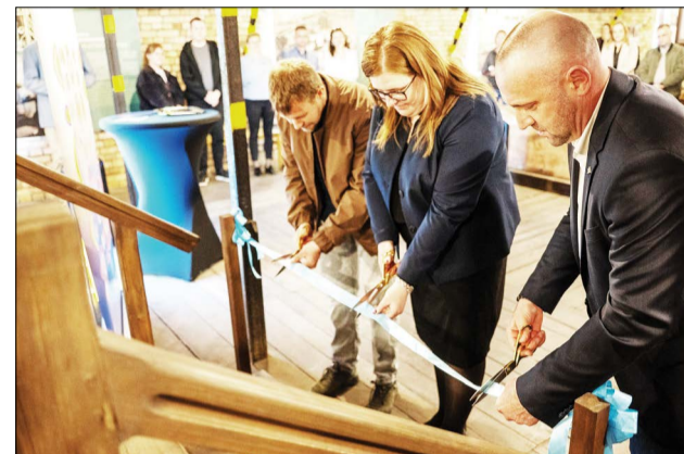
Otwarcie nowej wystawy w Muzeum Warzelnii Soli połączone z panelem dyskusyjnym na temat funkcjonowania ciechocińskich tęźni

W Muzeum Warzelnii Soli i Lecznictwa Uzdrowiskowego w Ciechocinku odbyło się otwarcie nowej wystawy czasowej, połączone z panelem dyskusyjnym z udziałem ekspertów na temat funkcjonowania tęźni. Wydarzenie wpisuje się w szerszy kontekst współpracy Uzdrowiska Ciechocinek S.A. z Uniwersytetem Mikołaja Kopernika w Toruniu.