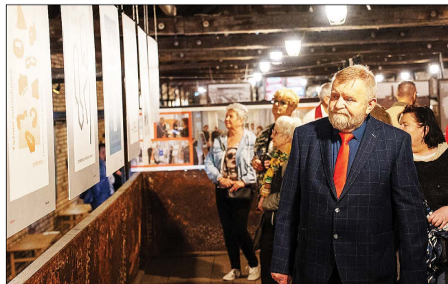
Wystawa w Muzeum Warzelnii Soli i Lecznictwa Uzdrowiskowego w Ciechocinku

Prezentowana w Muzeum Warzelnii Soli i Lecznictwa