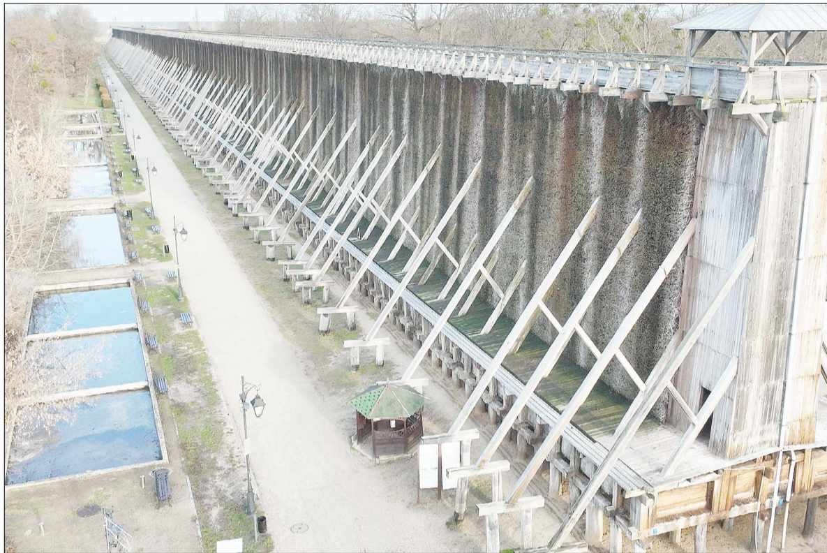
Trasa spacerowa wzdłuż tężni nr 1 z betonowymi zbiornikami, które mają zostać rozebrane