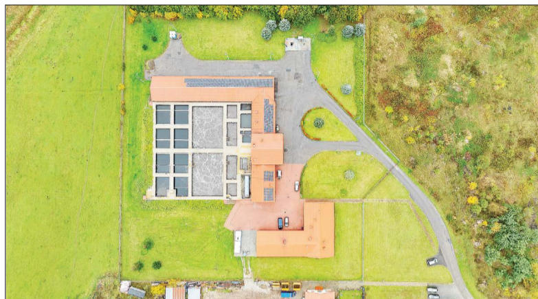
Ciechocińska oczyszczalnia z lotu ptaka

Dokładnie takich jak ciechocińskie Miejskie Przedsiębiorstwo Wodociągów i Kanalizacji sp. z o. o. (MPWiK). Ta niebagatelna kwota pozwoli spółce unowocześnić istniejące systemy teleinformatyczne oraz dostosować poziomy ich ochrony do występujących współczesnie zagrożeń, a w efekcie zapewnić odbiorcom podwójny spokój: o bezpieczeństwo danych klientów oraz o stabilne, bezpieczne i nieprzerwane dostawy wody.