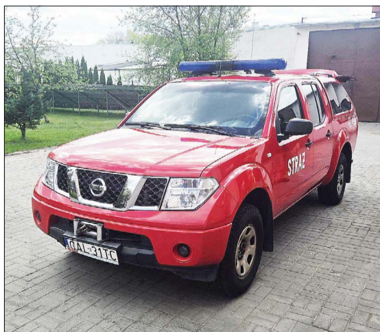
Nissan przekazany przez strażaków zawodowych druhom z jednostki OSP w Ciechocinku